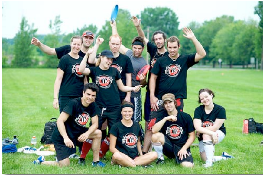
Équipe Passion Flick-y, Tournoi de début de saison en juin 2008