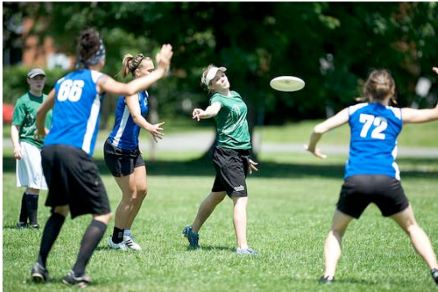
Photo prise lors du Tournoi Jazz de Montréal 2008